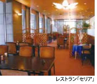
レストラン「セリア」