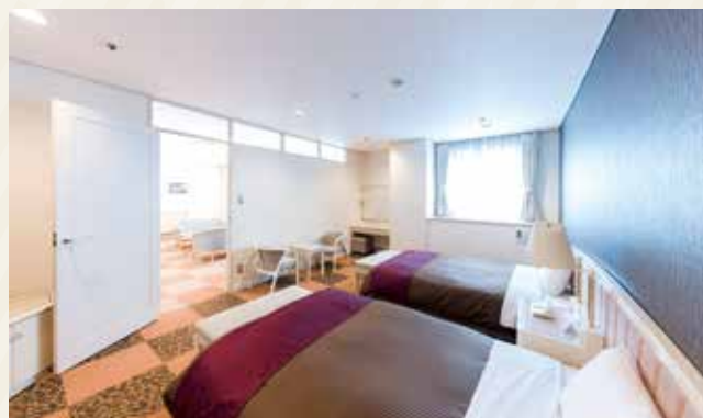
客室の一例《特別洋室》

8畳の和室と2台のベッドをご準備しており、最大6名様がゆっくりとお過ごしいただけるお部屋です。