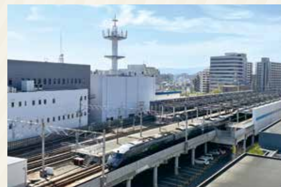
列車が見える部屋

お子様や鉄道ファンにおすすめ! 最上階の和室のお部屋からは新幹線、JR九州の列車が見えます。