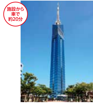
メニューNo.676245 福岡タワー(福岡市早良区)