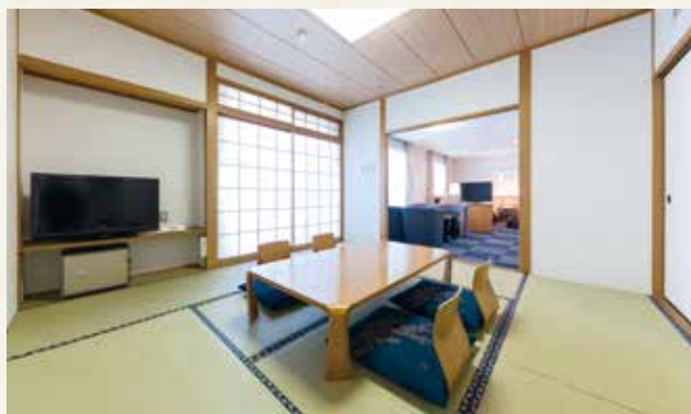
客室の一例《和洋室》

8畳の和室と2台のベッドをご準備しており、最大6名様がゆっくりとお過ごしいただけるお部屋です。