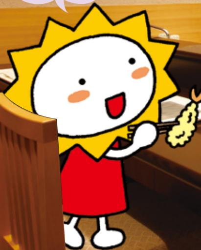
共済の宿イメージキャラクター サニーちゃん